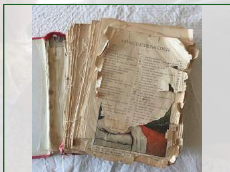
Vóór het herstel

Om de drie weken zijn de Boekbinders van Dik Trom in de werkschuur oude boeken aan het repareren. Oude boeken zijn meestal vele keren gelezen en dat eist zijn tol. Op de meest kwetsbare plaatsen gaan ze kapot [meestal de rug].