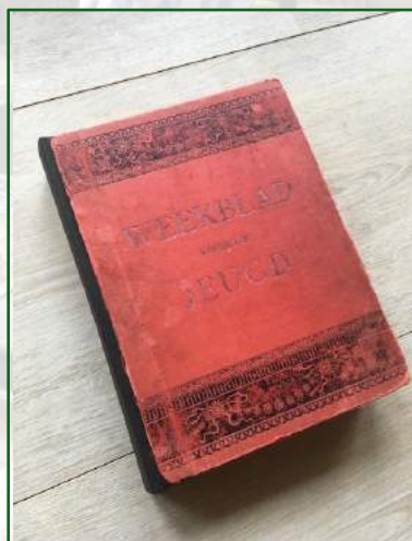
Na het herstel

Er zijn meerdere pogingen ondernomen om nieuwe vrijwilligers via vrijwilligerscentrales uit de regio aan te trekken, maar tot dusver zonder veel succes. We zullen daar meer en continu aandacht aan moeten geven