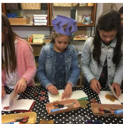
Knutselen tijdens een partijtje

Na een grondige voorbereiding door een groepje vrijwilligers en een 'proeffeestje' organiseren we vanaf 2017 kinderpartijtjes in het Schooltje voor groepen van 6 tot 12 kinderen.