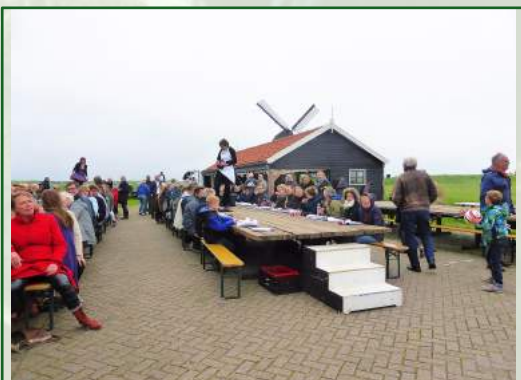
Rampendiner in Etersheim